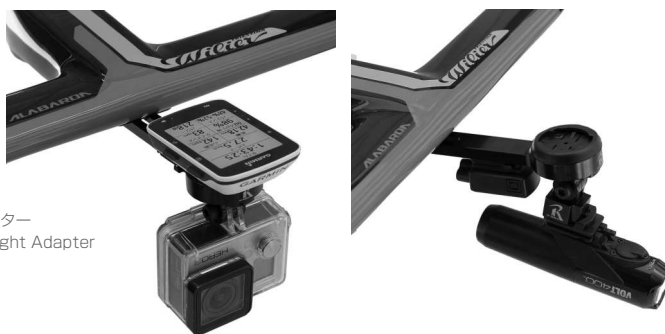
取り付けイメージ / Installation image